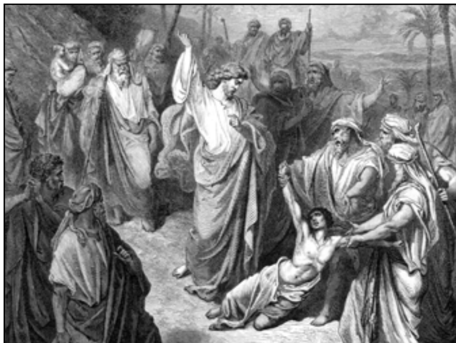
Иисус исцеляет немого бесноватого (Мф. 9, 32-34). Гравюра Г. Доре

Из близких к нам по времени святых, по чьим молитвам исцелялись одержимые, можно назвать прп. Серафима Саровского, Иоанна Кронштадтского и многих других. Но никакого специального чина отчитки они, насколько известно, не практиковали. Лишь горячо молились об одержимых, и Господь по их молитвам даровал исцеления. Во все времена христиане в болезнях душевных и телесных прибегали в молитве к помощи святых, Божией Матери, Спасителю и по Промыслу Божию