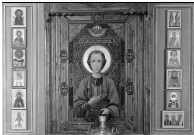
Икона святителя Николая. Икона апостола и евангелиста Иоанна Богослова. Икона великомученика и целителя Пантелеимона.