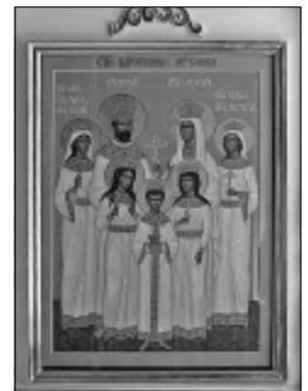
Фрагмент иконостаса Зимней церкви. Икона Богородицы «Помощница в родах». Икона святых Царственных страстотерпцев.

Известность этого образа Богородицы вышла за пределы прихода, обращаются к Ней молодые мамы и их родные, многие женщины приезжают перед родами, и Матерь Божия никому не отказывает в помощи. Благодарные молитвенницы оставляют перед иконой свои пожертвования.