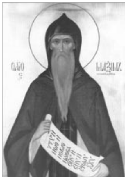
Преподобный Максим Исповедник

Важнейшей предпосылкой сотериологии св. отцов является их антропология, включающая в себя учение о творении человека, его природе и назначении, о райском состоянии первых людей, их грехопадении и последствиях грехопадения. В главнейших своих чертах она почти повторяет библейское повествование. Созданный по образу Божию человек состоит из души и тела. Ни душа, ни тело в отдельности не составляют целого человека, но являются только его частями. В раю первые люди имели все блага богообщения, однако связанное с этим совершенство не могло быть получено человеком во всей его полноте в самый момент создания. Лишь в результате длительного пребывания в общении с Духом Божиим человек постепенно преуспевает и восходит к совершенству. По мысли св. Феофила Антиохийского, человек был создан ни смертным, ни бессмертным, но «способным к тому и другому, чтобы, если устремится он к тому, что ведет к бессмертию, исполняя заповедь Божию, получил от Него в награду за это бессмертие, и сделался бы богом; если же уклонится к делам смерти, не повинувшись Богу, сам был бы виновником своей смерти. Ибо Бог создал человека свободным и самовластным». Человек употребил «самовластие» во зло – нарушил данную ему Богом заповедь, и в этом заключалось его грехопадение. Через грех непослушания отступничество возобладавало нами, и нас, по