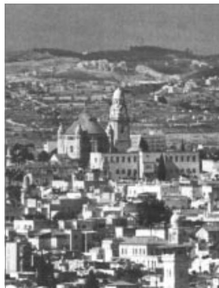
Иерусалим. Храм Успения Божией Матери, построенный на месте дома Иоанна Богослова на Сионе