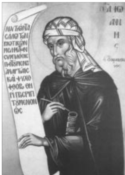
Преподобный Иоанн Дамаскин

Благодетель человека лишился в результате грехопадения. Но всеблагий Господь и после падения человека не отступил от него, а заботился о его воссоздании и спасении. Это воссоздание было осуществлением предвечного плана домостроительства нашего спасения.