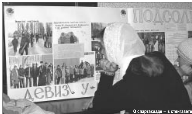
О спартакиаде – в стенгазете