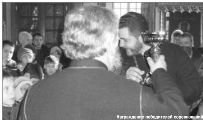
Награждение победителей соревнований