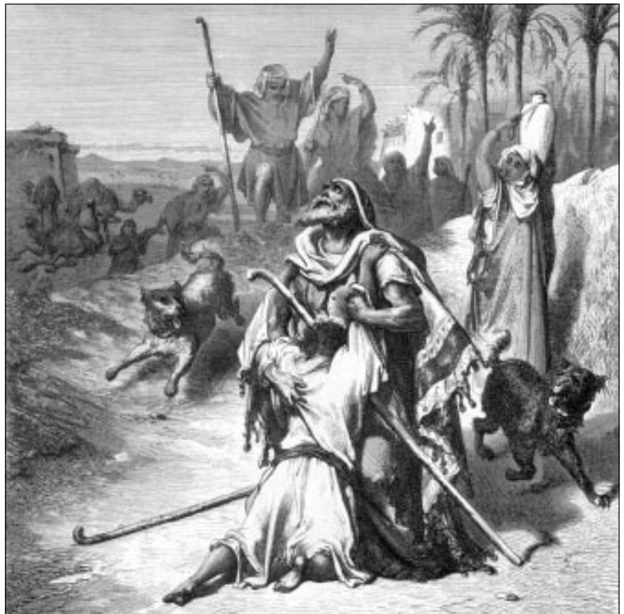
Встреча блудного сына с отцом. Гравюра Г. Доре

Вот ты сохранил свои силы и здоровье. А у меня их уже нет... Только остатки их я принес обратно в дом отца. И это разрывает мое сердце.