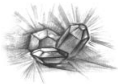
(Рисунки Полончук С.В.)

Лицо Артабана преобразилось: на него легла печать величавого спокойствия и самой светлой, полной радости; он облегченно вздохнул всей грудью, благодарно поднял к небу свои очи и навеки почил. Кончились долгие странствования старого волхва, нашел, наконец, Артабан Спасителя, были приняты и его дары.