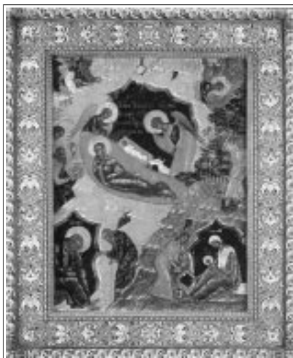
Рождество Христово. Икона праздника