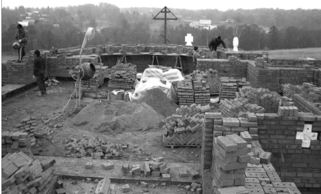
Полным ходом идет строительство храма во имя Новомучеников и исповедников Российских в с. Митрополье

Все более возрастающее почитание новомучеников и исповедников Российских XIX в. является живой чертой благочестия православного народа нашего времени.