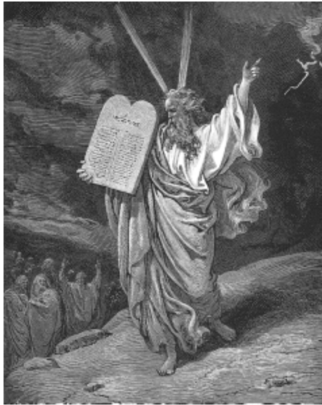
Моисей со скрижалями Завета (Исход 19, 25). Гравюра Г. Доре

И наилучшая социальная возможность проявления высших человеческих чувств и дел создает-