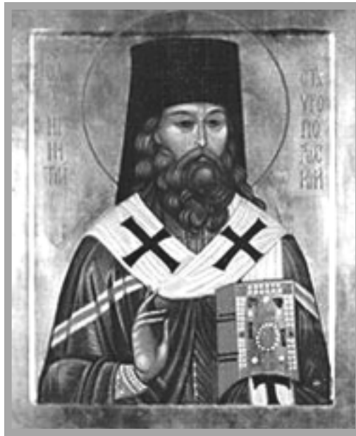
Святитель Игнатий (Брянчанинов). Икона Канонизирован Поместным Собором Русской Православной Церкви в 1988 г.

«Обыкновенно люди считают мысль чем-то мало важным, потому они очень мало разборчивы при принятии мысли. Но от принятых правильных мыслей рождается все доброе, от принятых ложных мыслей рождается все злое. Мысль подобна рулю корабельному: от небольшого руля, от этой ничтожной доски, влачащейся за кораблем, зависит направление и, по большей части, участь всей огромной машины», – так писал святитель Игнатий, подчеркивая то исключительное значение, какое имеют наши мысли, взгляды и теоретические знания в целом для духовной жизни (IV, 509). Не только правильная догматическая вера и евангельская нравственность, но также знание и неукос-