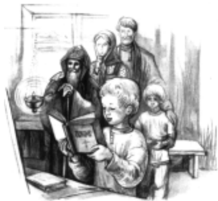
(Из книги «Детям о слове»)

Так и свершилось. Варфоломей стал великим святым – преподобным Сергием Радонежским.