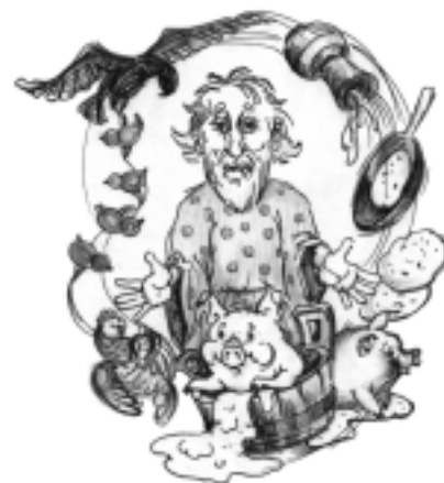
Рис. Полончук С.В.

– А как же я управлялась каждый день? Вот то-то и есть, не спорь, не говори, что бабам нечего делать!