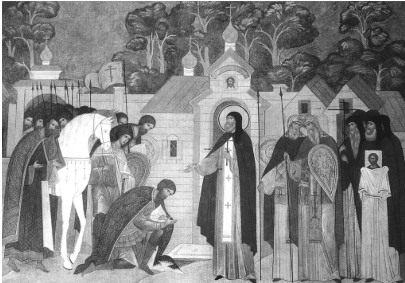
Преподобный Сергий благословляет великого князя Московского Дмитрия Донского на Куликовскую битву Фрагмент росписи Серапионовой палаты Троицкого собора. Троице-Сергиева Лавра

Мы много думаем о спасении России, и подчас оно кажется нам невозможным. Но мы забываем, что верующий получает от Бога даже то, на что не смеет надеяться. Будем же хранить и возгревать в своих сердцах нашу святую православную веру, и тогда спасется и каждый из нас, и Отечество наше.