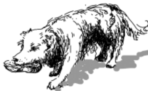
Рис. Полончук С.В.