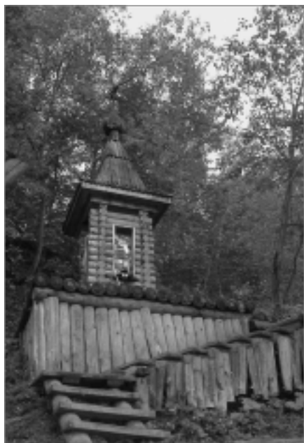
Часовня на источнике прп. Сергия Радонежского в с. Малинники