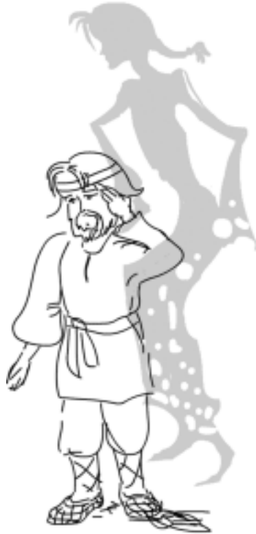
Рис. Полончук С.В.

Заколотил он гроб и отнёс на кладбище, закопал её, и стала ему с тех пор во всё удача сопутствовать, и поправился бедняк. Богатый брат узнал об этом и позавидовал ему. Вот приходит к нему и говорит: