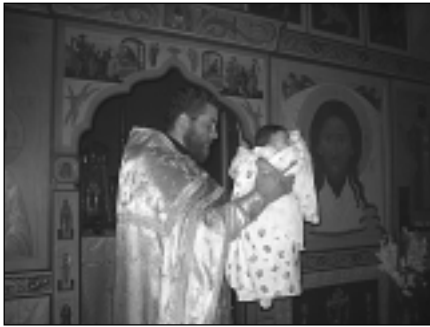
Чин воцерковления.

Что совершилось ныне над Господом и Спасителем нашим во храме Иерусалимском, подобное тому совершено было, братия мои, некогда над каждым из нас. И мы, подобно Ему, были принесены во храм, поставлены пред