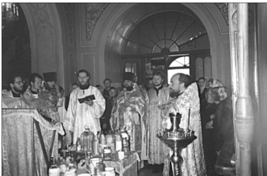
Водосвятный молебен. 1997 г.

Святая вода освящается священником в храме крестом и молитвой и потому имеет благодать прогнания бесовской силы, в самых различных ее проявлениях. Это хорошо знали наши предки, к духовному опыту которых нам необходимо возвращаться.