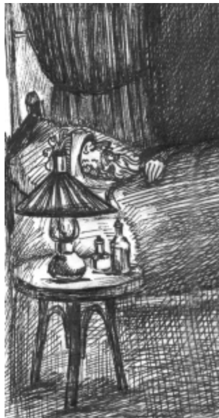
Рис. Полончук С.В.

Итак, христианин, не падай духом, но терпи, когда постигнут тебя болезни, и уповай на Бога. Много бывает у нас болезней, иногда постепенно, а то и быстро, разъедающих наше тело, против которых бессильны самые опытные и знаменитые врачи. Будем же терпеливы в перенесении болезней и из глубины сердец воззовем: «Отче Святой, Врачу душ и телес наших! Исцели всех нас от обдержавших телесных и душевных немощей; оживотвори нас благодатию Христа Твоего, молитвами Пресвятыя Богородицы и всех святых, от века Тебе благоугодивших!».