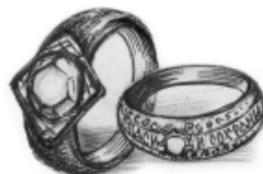
Рис. Полончук С.В.

А Тихий Иван в своей семье жил безбедно и любовно многие годы. И когда пришла к нему старость, у него уж было семеро ребят; правда, они были не богаты, но большой нужды не знали: Бог даёт детей, даёт и на детей. Взглянет Тихий Иван на жену-старушку, на детей послушных, и промолвит: «Нет числа милости Божьей к нам, грешным».