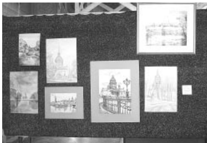
Рук человеческих творенье во славу своего Творца... Экспонаты выставки «Пасхальный дар»