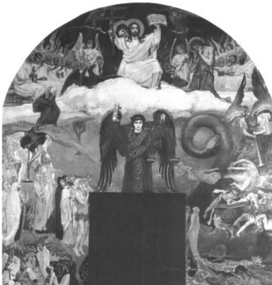
В.М. Васнецов. Страшный суд. Эскиз росписи для Владимирского собора в Киеве. ГТГ

Отметим, что православная иконография разнообразно разработала тему Последнего Суда, сначала в символическом сюжете о пастыре, отделяющем овец от козлиц (храм святого Аполлинария в Равенне, пригл. 520 г.), а позднее – реалистически изображая Христа, являющегося «на облацах» и сидящего на Престоле среди апостолов, чтобы судить живых и мертвых, которых будит труба Архангела (Собор в Торчелло, XI в.).