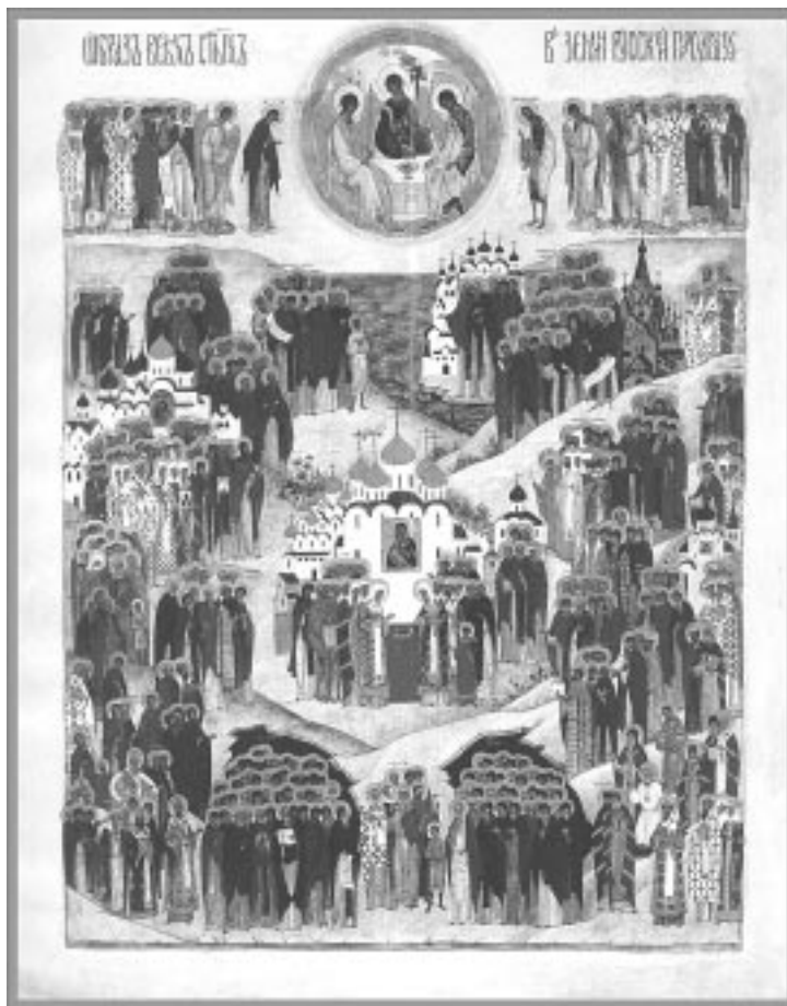
Все святые, в земле Российской просиявшие. Икона. Троицкий собор Данилова монастыря г. Москвы

По-разному люди понимают «счастье». Одни полагают, что оно заключается в материальном благе, другие – в чувственных наслаждениях, третьи – в достижении власти, славы земной. Но еще древние мудрецы доказывали из своего жизненного опыта, что это все суета сует и томление духа. И что одно надлежащим образом утешает человека и доставляет ему мир и радость, это – богобоязненная