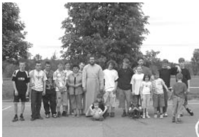
Эпизод баскетбольного матча в Могилцах и его участники, судьи и болельщики