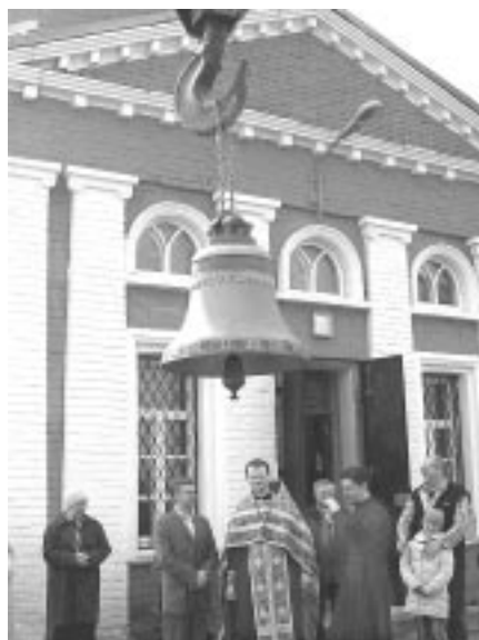
Село Алёшино. Освящение и подъем колоколов.