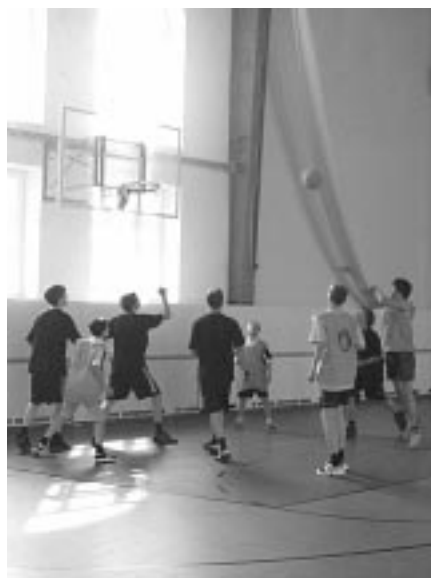
В игре на выезде «подсолнухи» победили.