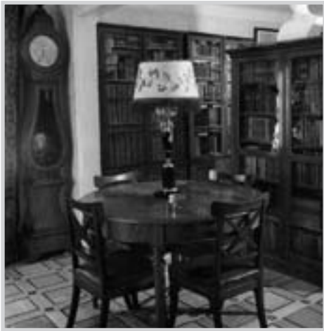
Воскресная школа на экскурсии. Библиотека.

из самых уютных в доме. Теплый колорит ей придают старинные шкафы красного дерева, за стеклами которых поблескивают золотом корешки книг. Авторы этих книг были связаны дружбой с хозяевами Муранова. Имя