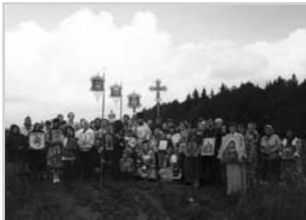
Молебен о безветрии, во время которого выглянуло солнце и установилась хорошая погода.

Замечали ли вы тяжкую скорбь на лицах, изнуренных неизлечимою болезнью, при виде обновляющейся природы? Им