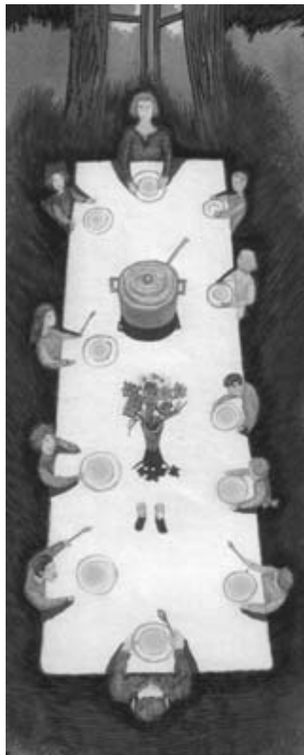
Из сборника «Россия – последняя крепость»

Дети по заповеди Божией должны любить отца и мать, слушать и почитать их. За это Господь обещает им благо и долголетие (Исх. 20, 12). Этому учит и «Домострой»: «Вы же, дети, делом и сло-