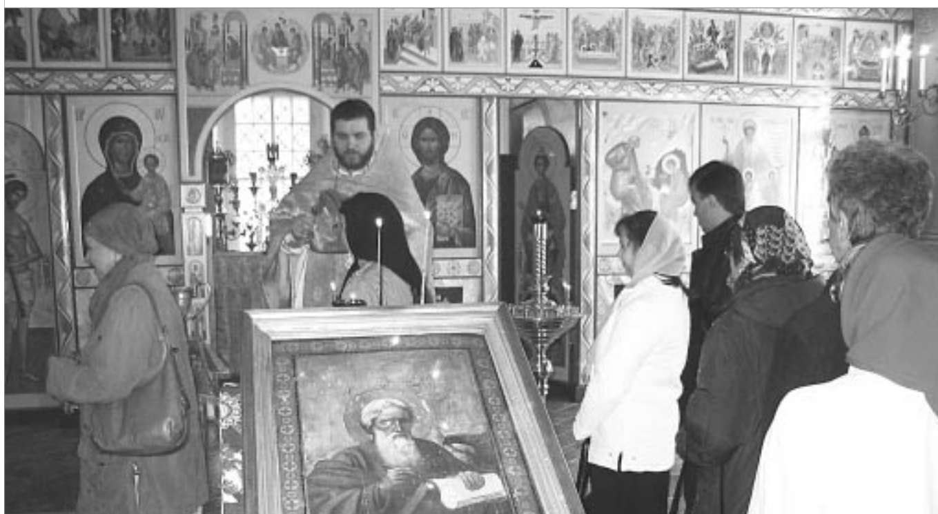
Фотолетопись приходской жизни: 9 октября 2005 года. Престольный праздник в отреставрированном храме.