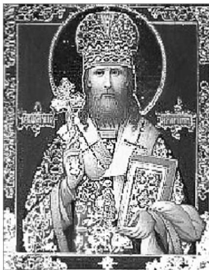
Архиепископ Верейский Иларион (Троицкий). Икона. Канонизирован Юбилейным Архиерейским Собором Русской Православной Церкви в 2000 г.

Библейский рассказ о «столпотворении Вавилонском» имеет весьма глубокий смысл. Как раз перед этим рассказом Библия сообщает о первых успехах грешного человечества в области культуры и гражданского общежития; перед, столпотворением именно начали люди создавать каменные города. И вот смесил Господь языки живущих на земле, так что они перестали понимать друг друга и рассеялись по всей земле (Быт. 11, 4, 7-8). В этом «столпотворении Вавилонском» дан как бы некоторый тип гражданской или государственной общественности, основанной на одной только правде человеческой, на праве. Наш русский философ В.С. Соловьев так определил право: «Право есть принудительное требование реализации определенного минимального добра или порядка, не допускающего известных проявлений зла». Но если принять даже и это определение права, оно, очевидно, все же никогда не совпадет с христианской любовью. Право касается внешности и проходит мимо существа. Общество, созданное на человеческом праве, никогда не может слить людей воедино. Единение разрушается себялюбием, эгоизмом, а право не уничтожает эгоизма; напротив, только утверждает его, охраняя его от покушений со стороны эгоизма других людей. Цель государства, основанного на праве, в том, чтобы создать по возможности такой порядок, при котором эгоизм каждого его члена находил бы себе удовлетворение, не нарушая в то же время интересов другого. Путь к созданию такого порядка может быть один – некоторое ограничение эгоизма