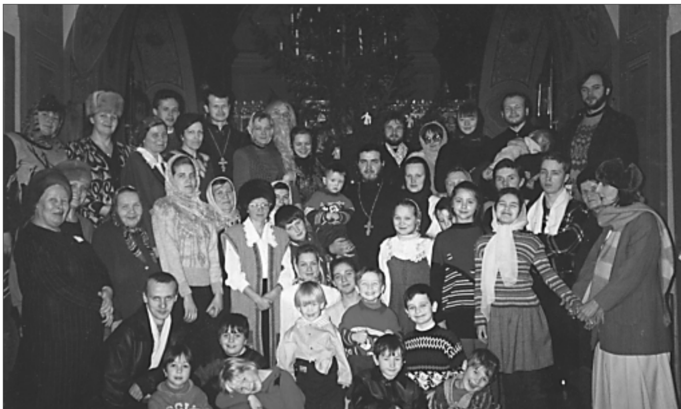
Первая Рождественская Ёлка. 1995 г.

Не дай Господь, кого-нибудь забуду, поэтому искренне низко кланяюсь и благодарю всех, начиная от жителей с. Могильцы, на которых лежит основная забота по поддержанию благолепия и порядка в храме, и заканчивая многочисленными прихожанами из пос. Лесного, которые на протяжении многих лет безвозмездно трудятся в храме; периодически появляются и новые люди из других селений. Кого из прихожан ни попроси о помощи – никогда отказа не будет. Священники часто делятся