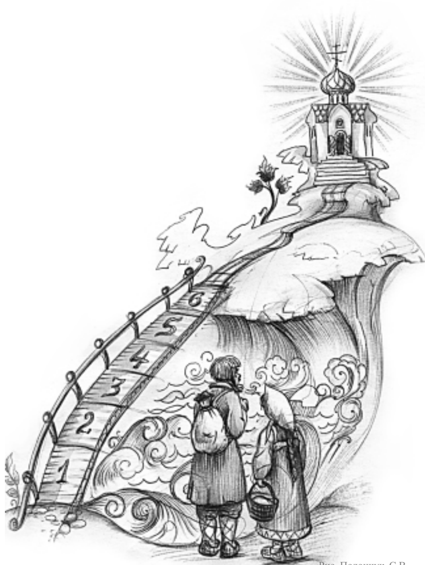
Рис. Полончук С.В.