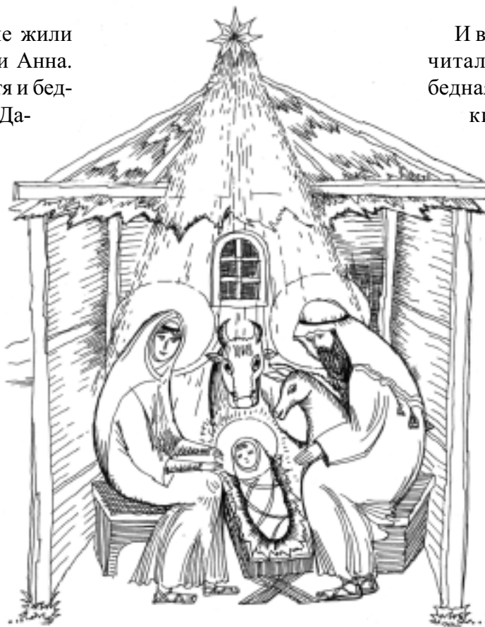
Иисус, Сын Божий, лежал в яслях, а над пещерой, где Он родился, засияла очень красивая, большая звезда

Все Свое детство провела Мария в храме. Усердная и кроткая, Она всегда молилась Богу и была очень трудолюбива. Она не имела дорогих платьев и всегда была очень скромно одета. Но зато Она была очень аккуратна и трудолюбива. Все невольно любили кроткую девочку и удивлялись, что Она такая скромная и умная.