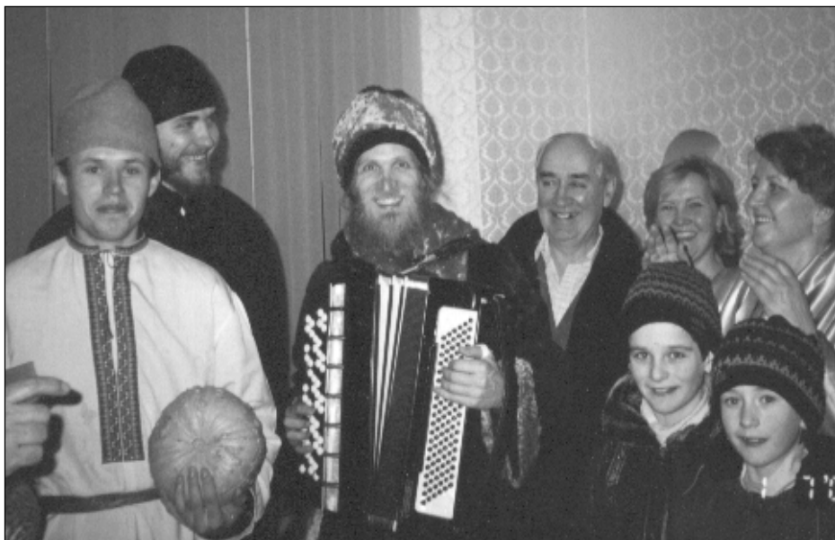
Колядки – радость в дом.

* Тропарь – короткая церковная песня, объясняющая смысл праздника.