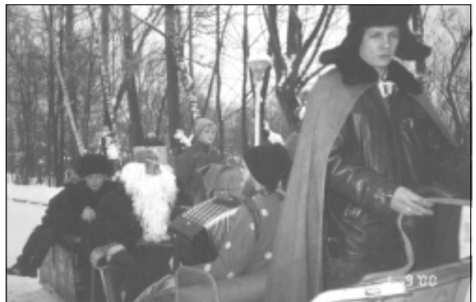
Приезд Деда Мороза на Рождественскую Ёлку. 2000 г.

(по материалам журнала «Русский дом», №1 2002 г.)