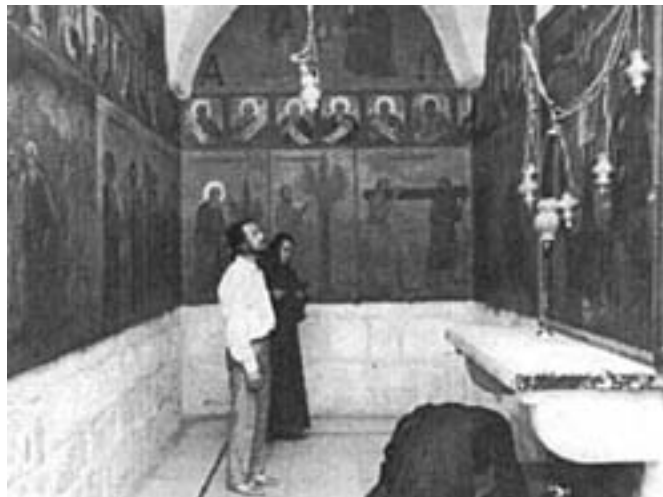
Место, где росло Древо крестное, находится в пещере под алтарем.

Хеврон, роща Мамре... Даже в ветхозаветные времена место, где поселились Авраам и Сарра, было овеяно памятью событий еще более древних по пре-