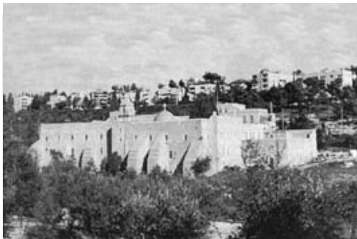
Монастырь Святого креста Господня.

мый воплем сверхъестественных их грехов, день и ночь к Нему взывающих и требующих отмщения. Может быть, и ради того в Двух, а не в Трех Лицах к Содому пришел, дабы тот греш-